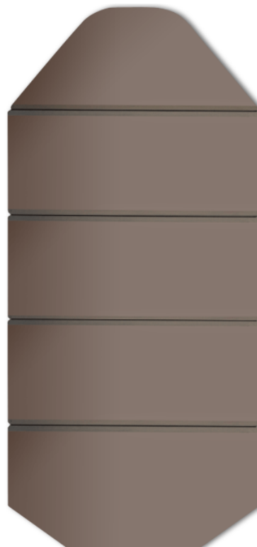
Podłoga pełna sztywna (KSIĄŻKA)