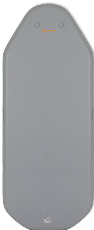
Podłoga Pompowana (AIR-DECK)

Pontony wiosłowe z indeksem „T” posiadają uchwyt do silnika, usztywnianą podłogę oraz listwę odbojową.