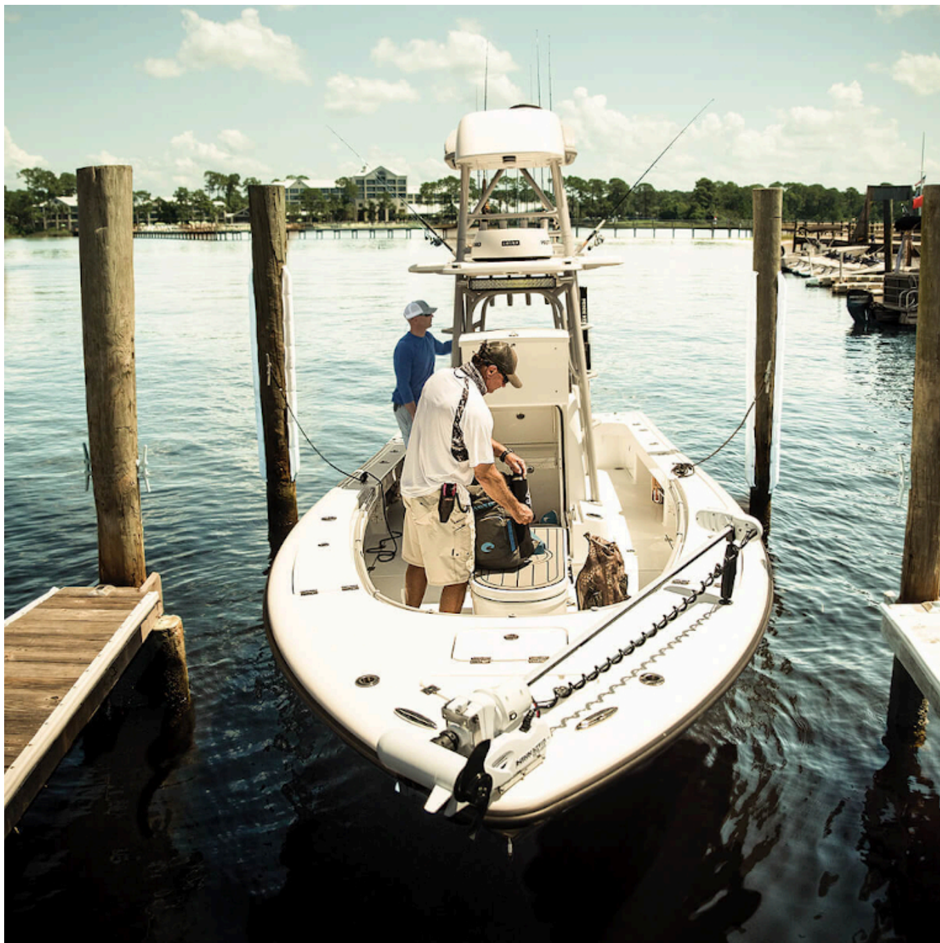
Minn Kota Ultrerra Commercial